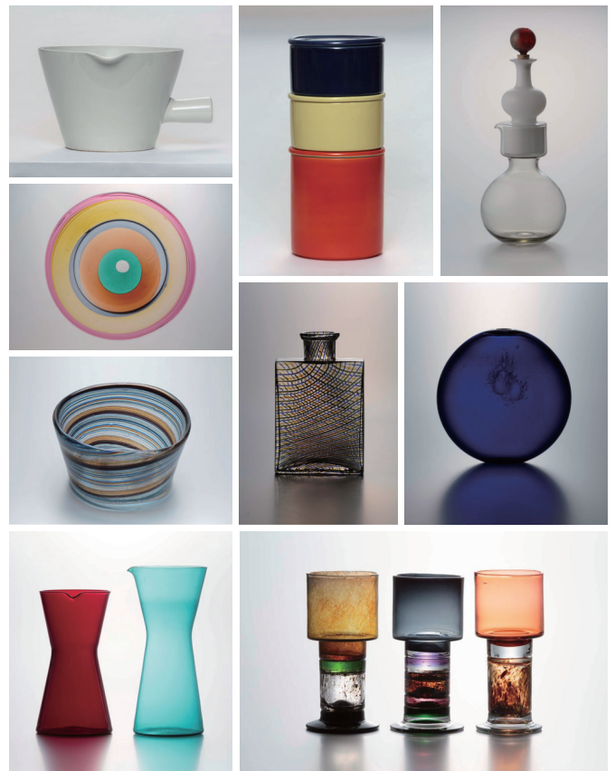
カイ・フランク作品 タウノ・タルナ氏コレクション

フィンランドと日本は、四季や自然を愛でる、機能性、シンプルなデザインを好む、上質な匠の技を持つなど多くの共通点があります。でも日々の暮らしの楽しみ方やデザインへの理解度は、日本はまだ充分とは言えないのが現状です。「世界一幸福な国フィンランド」から学ぶことが数多くあるはずで、「デザインとはデザイナーが名を残すためにあるのではなく、人々の日常で長く使われ必要とされるためにある」というカイ・フランクのデザイン思想やフィンランド文化を通じて、日々の暮らしの楽しみ方のヒントやテーマ“暮らしを変えるデザイン”を考える機会になれば幸いです。