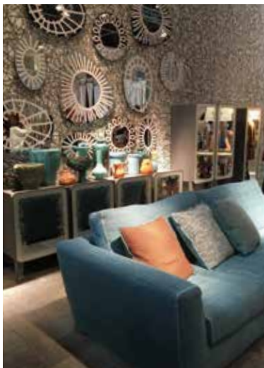
Milano Salone 2018