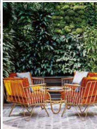
Paris HOTEL 2018