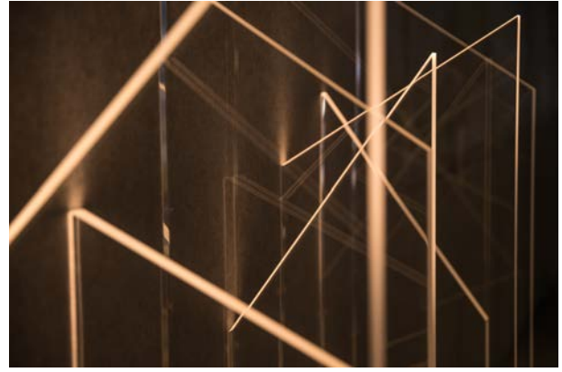
【アクリルパネルを使用したゾーニングのご提案】