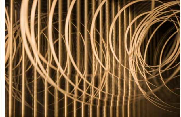
【アクリルパネルを使用したアートオブジェのご提案】