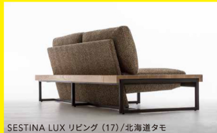
SESTINA LUX リビング (17)/北海道タモ