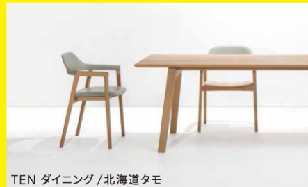
TEN ダイニング/北海道タモ

できることなら、近くの山から伐り出した木で、家具をつくりたい。枯渇していた北海道の木材資源がここ数十年で着実に増えています。今こそ、この恵みを産地全体で活用するとき。「日本の森を守る家具づくり」旭川から、始めます。